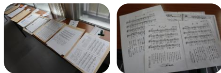
14種類の歌詞カード！ 選曲を担当する対象者がいます

その他の参加者は、使用する歌詞カードを束ねて、テーブルに置く作業があります！委員さんだけではなく参加者の皆さんも役割があることは、みなさんの“生きがい”にもつながりますね！