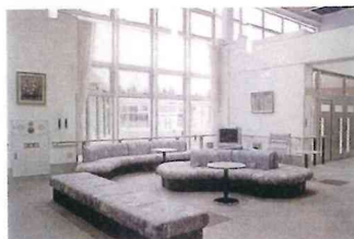
集会室 (談話コーナー)