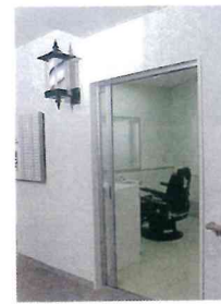
おしゃれサロン (理容室)